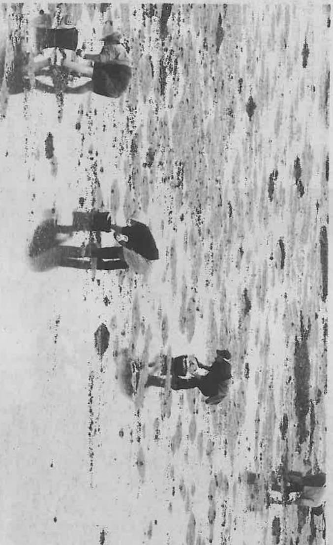
Las mariscadoras de Vilanova suspendieron ayer su jornada de trabajo